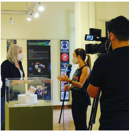
Fotografías de la exposición.