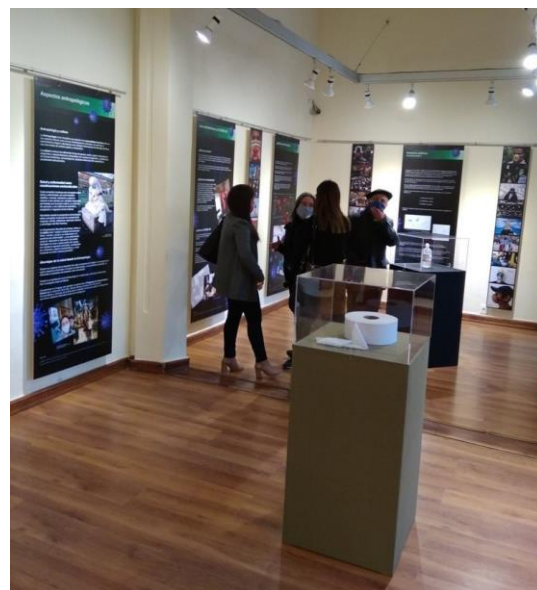
Fotografías de la exposición.