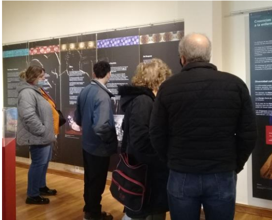
Fotografías de la exposición.