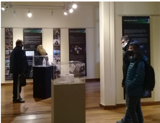
Fotografías de la exposición.