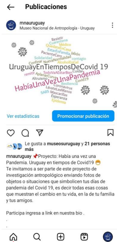
Invitación a participar en el proyecto.

El proyecto suscitó el interés de la prensa nacional, a través de programas de radio y televisión informaba sobre este e invitaba a participar. Se comenzó a recibir vivencias como dibujos, fotografías, videos y testimonios escritos.